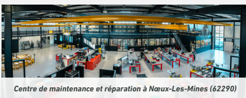
Centre de maintenance et réparation à Nœux-Les-Mines (62290)