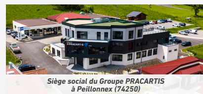
Siège social du Groupe PRACARTIS à Peillonex (74250)