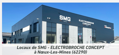
Locaux de SMG - ELECTROBROCHE CONCEPT à Nœux-Les-Mines (62290)

Pour les industriels désireux de moderniser leurs machines-outils, ce partenariat permet ainsi de proposer une solution globale dans l'optimisation de leur stratégie d'usinage.